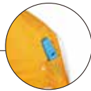
緊急用ホイッスル付