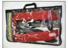
保管に便利な収納バッグ