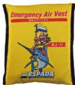
収納時サイズ: 23cm × 26cm